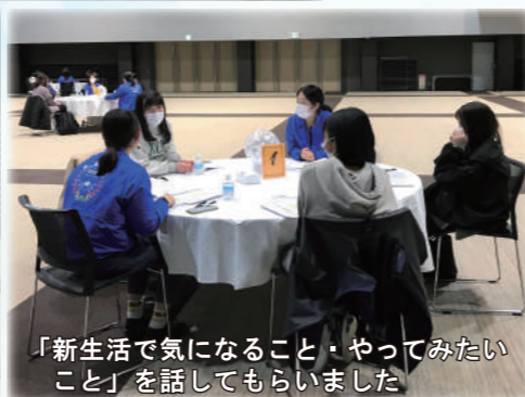
「新生活で気になること・やってみたいこと」を話してもらいました