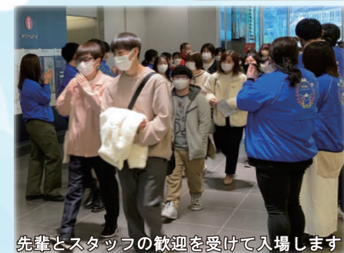
先輩とスタッフの歓迎を受けて入場します