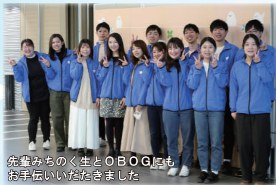
先輩みちのく生とOBOGにもお手伝いいただきました