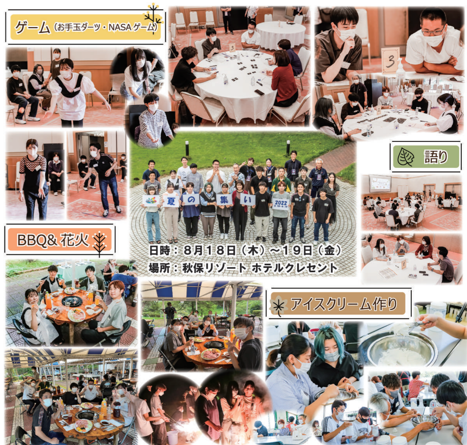
ゲーム (お手玉ダーツ・NASAゲーム)

Copyright(C) 2011 公益財団法人みちのく未来基金 All Rights Reserved.